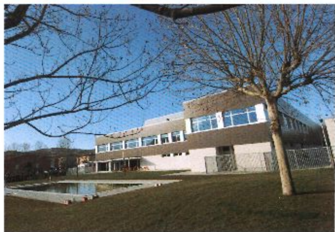
Kirol instalazioak Urdi S.L. k kudeatzen ditu 2013tik. 2018ko urtarrilaren 15ean errentamendu-epaia amaituko da eta aukera ezberdinak aztertzen ari dira.

Sin embargo esta labor de gestión no siempre es fácil, sobre todo desde la administración pública. Esto es debido no solo a la limitación de los recursos disponibles, sino también a la demanda de los ciudadanos que requieren servicios cada vez de mayor calidad.