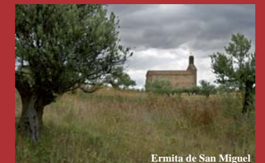
Ermita de San Miguel