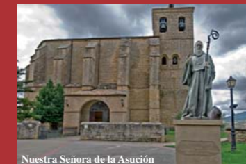
Nuestra Señora de la Asunción