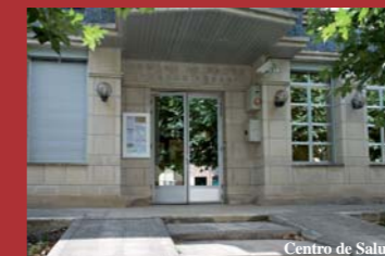
Centro de Salud